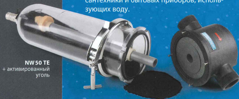
NW 50 TE + активированный уголь

Уголь поставляется отдельно и служит для улучшения вкуса воды, устранения запаха, очистки от хлора, озона, пестицидов и других загрязняющих органических веществ.